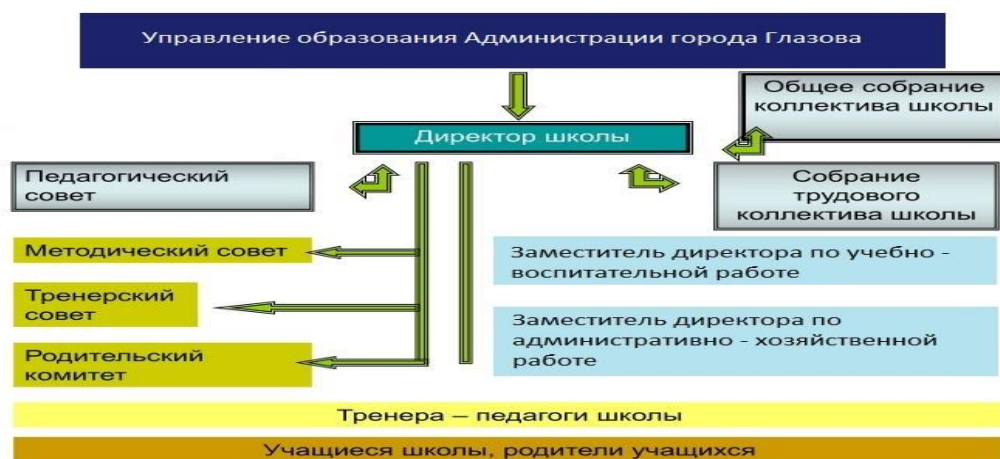
Рис. 2. Структура управления МБОУ ДО «ДЮСШ № 1» г.Глазов