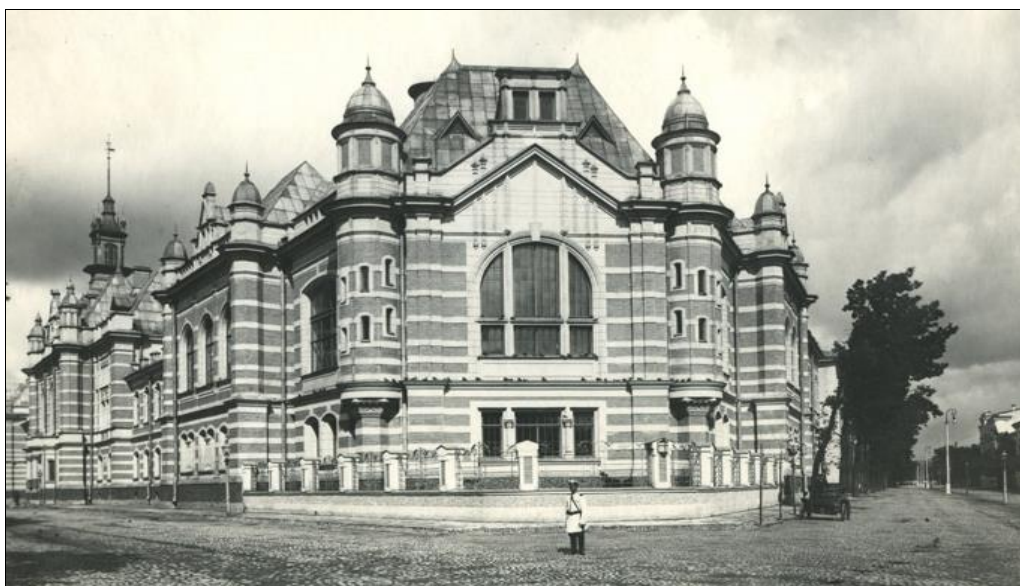
Рисунок 1 – Наименование иллюстрации

1.2.1. Иллюстрации (рисунки, графики, схемы, диаграммы, фотоснимки) следует располагать непосредственно после текста, в котором они упоминаются впервые, или на следующей странице. Иллюстрации нумеруются арабскими цифрами в соответствии с номером раздела (в документах небольшого объема – например, в отчете по лабораторной работе – целесообразно использовать сквозную нумерацию по всему документу), на все иллюстрации должны быть даны ссылки в тексте (например «см. рис. 15» или «как показано на рис. 3.14»). После номера иллюстрации может быть указано ее наименование (см. рис. 1).