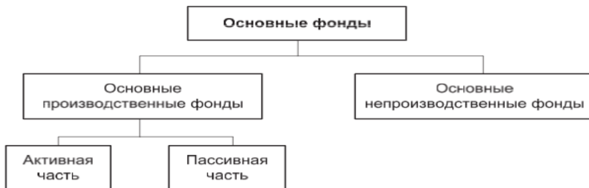
Рисунок 1 – Структура основных фондов предприятия 3

Основные производственные фонды предприятия функционируют в сфере материального производства, неоднократно участвуют в процессе производства, изнашиваются постепенно и переносят свою стоимость на создаваемый продукт частями, по мере снашивания. Отсюда и возникает необходимость классификации основных средств по составу, по структуре и по состоянию.