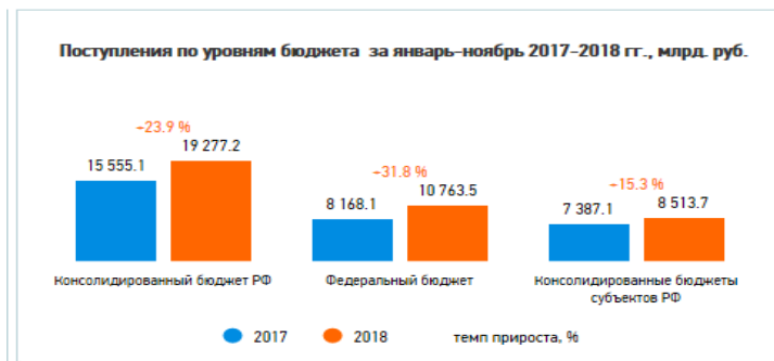
Рис.1.1 Поступление налогов по уровням бюджетной системы за 2017-2018гг. 1

Если графический материал является авторской разработкой, то это необходимо отметить.