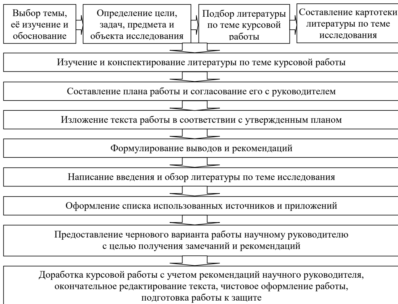
Рис. 1.1. Последовательность выполнения курсовой работы

Процесс написания курсовой работы в силу своей специфики требует согласования с научным руководителем. Правильно организовать выполнение курсовой работы, рационально распределить и спланировать свое время, глубоко и всесторонне разработать избранную тему помогает алгоритм написания научного исследования. Выполнять курсовую работу рекомендуется в следующей последовательности (рис. 1.1).